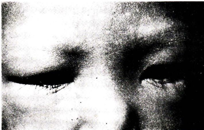
รูปที่ 2 อาการหนังตาบวม ซึ่งเป็นอาการสำคัญและพบบ่อยที่สุดในโรค acute glomerulonephritis และเป็นสิ่งสำคัญที่ทำให้ผู้ป่วยมาหาแพทย์