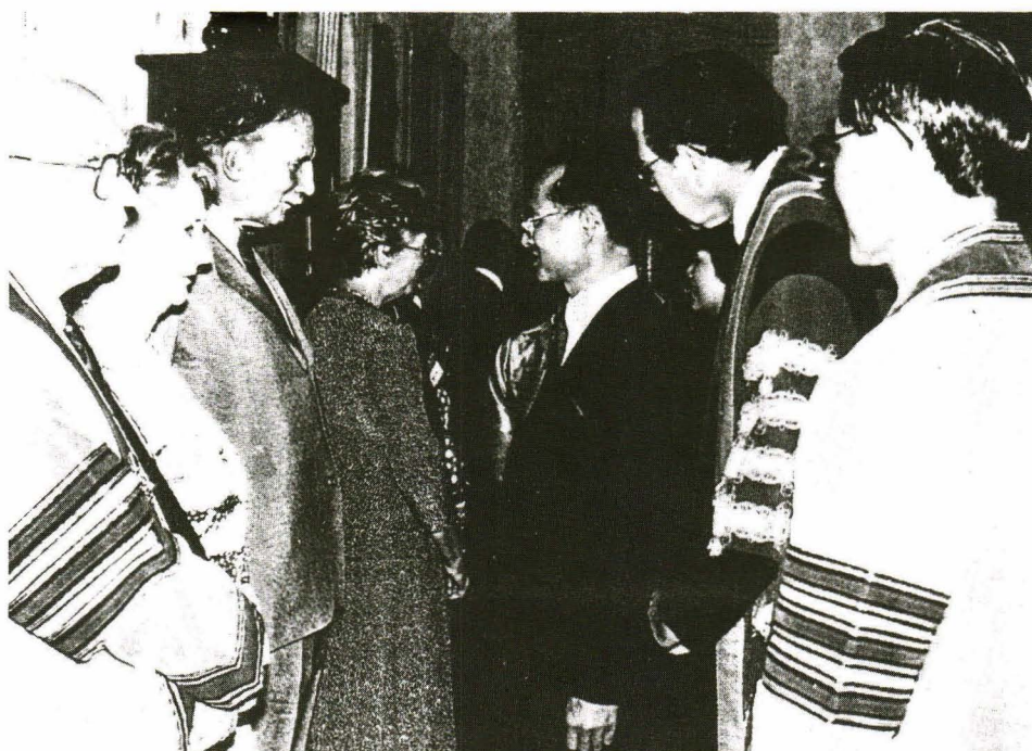
รูปที่ 3. และ 4. พระบาทสมเด็จพระเจ้าอยู่หัว ทรงพระกรุณาโปรดเกล้าให้ประธานราชวิทยาลัย แห่งประเทศไทย และคณะเข้าเฝ้า ฯ ณ พระที่นั่งจักรวรรดิราชมโหฐาน เมื่อวันที่ 3 ตุลาคม พ.ศ. 2532