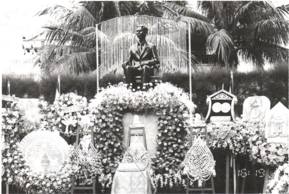
ภาพที่ 1 พระบรมรูปพระบาทสมเด็จพระปรเมนทรมหาอานันทมหิดล พระผู้พระราชทานกำเนิด คณะแพทยศาสตร์ จุฬาลงกรณ์มหาวิทยาลัย

พระบรมรูปพระบาทสมเด็จพระปรเมนทรมหา- อานันทมหิดล ประดิษฐานอยู่ที่บริเวณด้านหน้าตึก อานันทมหิดล ซึ่งเป็นตึกศูนย์กลางบริหาร คณะแพทย- ศาสตร์ ตำแหน่งที่ตั้งตึกนี้เดิมเคยเป็นตึกสรีรวิทยาเก่าที่ ต่อมาได้ใช้เป็นตึกสำนักงานคณะบดีอยู่จนถึง พ.ศ. 2525 จึงได้รื้อและสร้างตึกอานันทมหิดลขึ้นแทนและใช้ชั้นล่าง เป็นสำนักงานคณะบดี